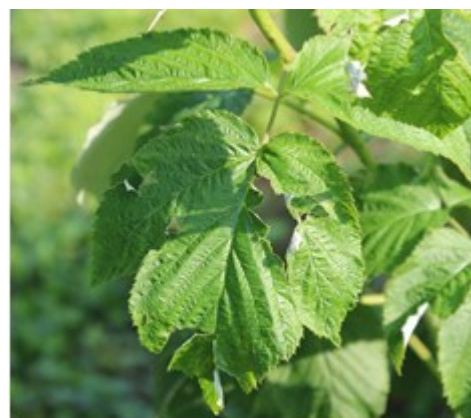
Fig. 3: Danni da grandine su lampone

Nelle zone interessate dalla grandine intervenire con un trattamento a base di Rame .