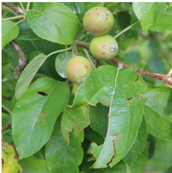
Fig. 2: Danni da grandine su melo

Si segnalano precipitazioni con intense grandinate avvenute tra domenica 25 e martedì 27 luglio. La grandine ha colpito in maniera significativa e in due momenti distinti le zone tra Darfo Boario Terme e Breno.