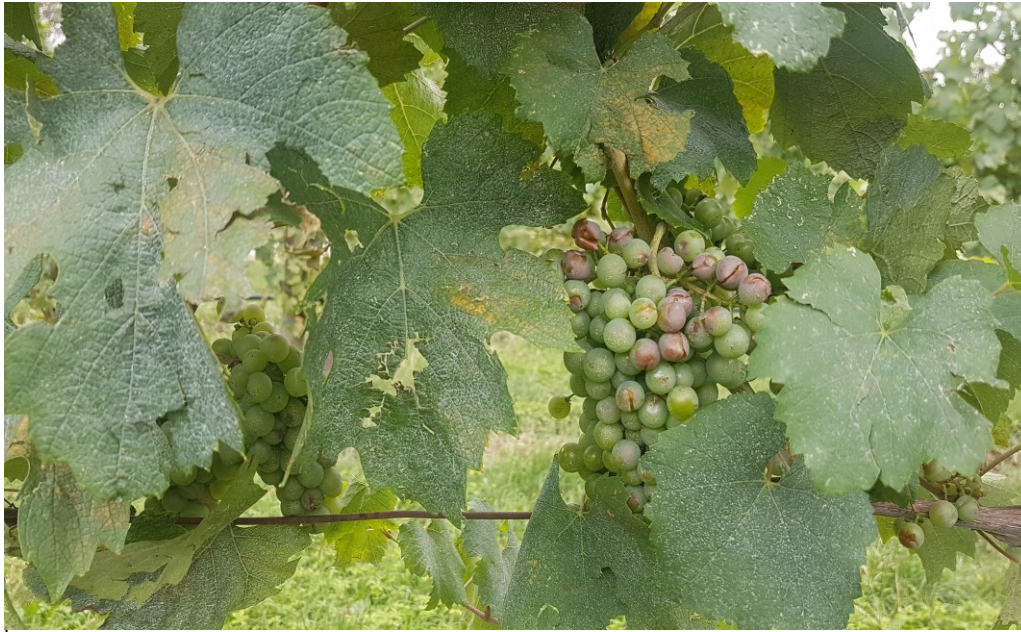
Fig. 1: Danni da grandine su vite

Nella giornata del 25 luglio 2021, si sono verificati fenomeni grandigeni in buona parte del comprensorio viticolo, con diversa intensità. La zona più colpita risulta essere parte della Val Grigna, Esine, Cividate, parte di Malegno, oltre parte della zona di Darfo.