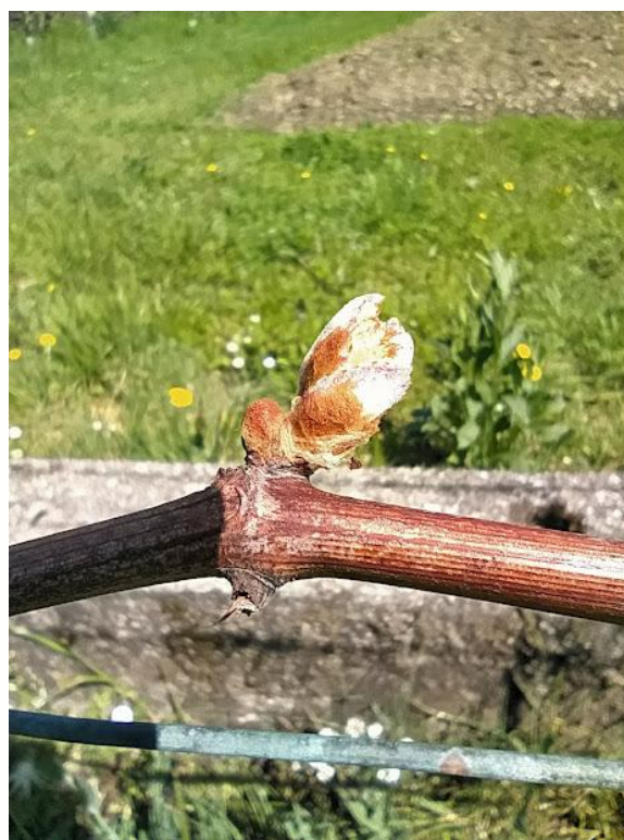
Foto 2 - Germogliatura