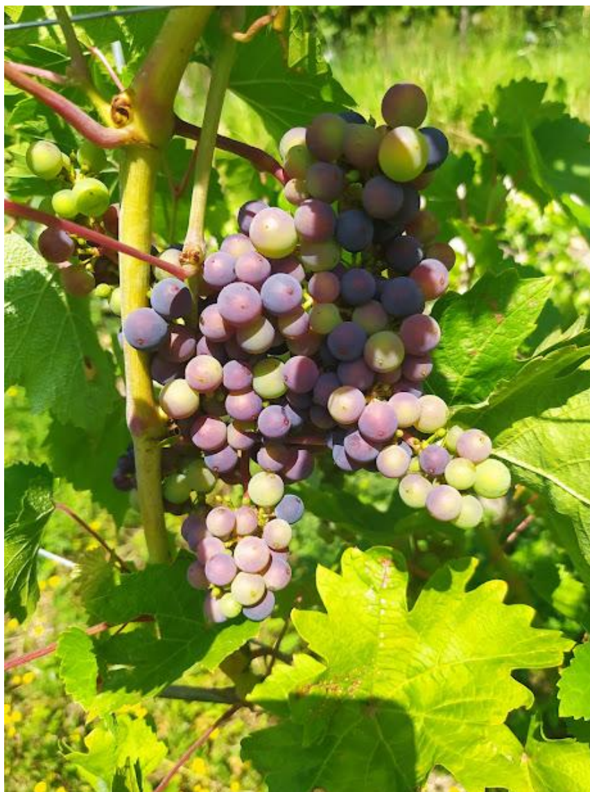
Foto 5 - Invaiatura